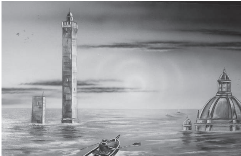
Das versunkene Bologna